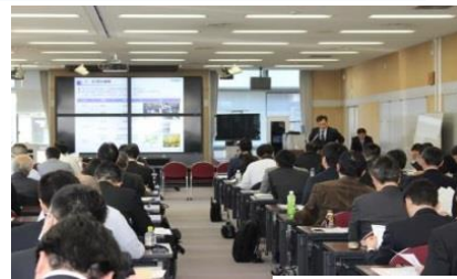
（昨年度の開催の様子）

懇親会に参加される方は、お一人5,000円（予定）となります。ざっくばらんな会ですので是非お気軽にご参加ください。