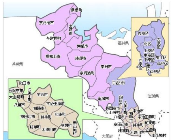
京都府内の行政区