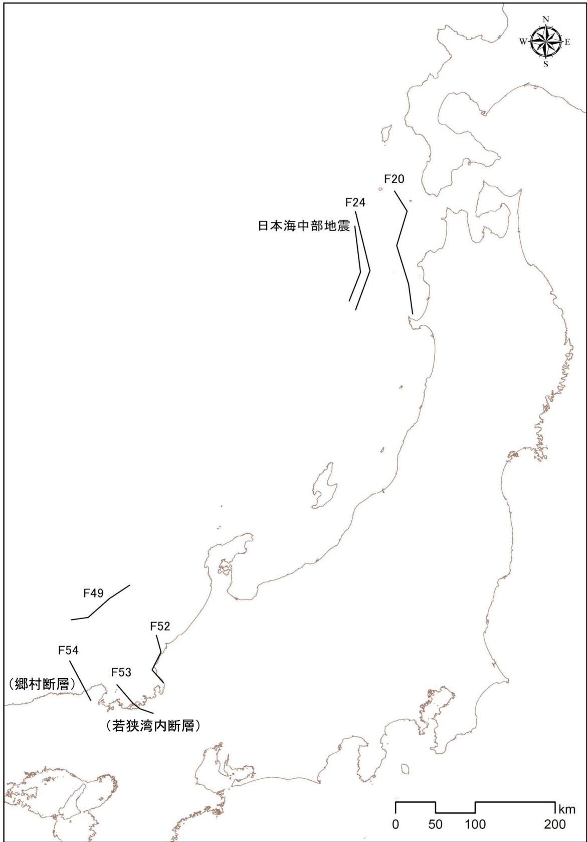
図2 被害想定の対象地震の断層位置