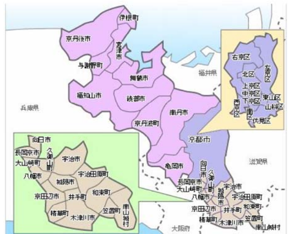
京都府内の行政区界