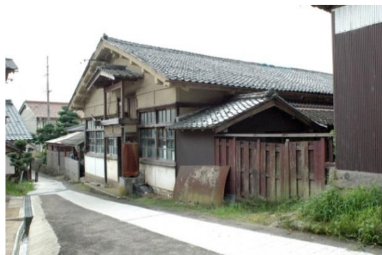
(西山機業場の織物工場)