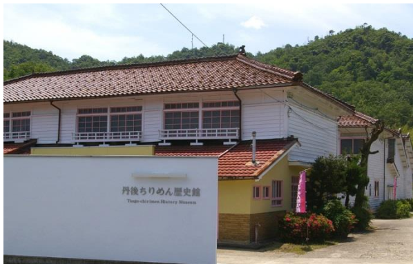
(丹後ちりめん歴史館)