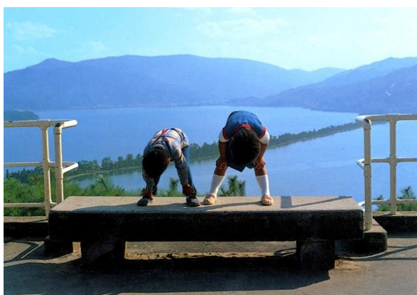
(傘松公園での「股のぞき」)