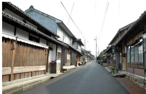
28 ちりめんの道の機屋の町並み