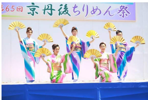
(京丹後ちりめん祭)