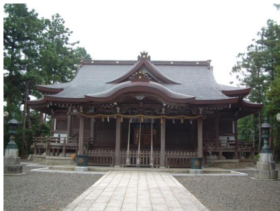
(金刀比羅神社本殿)