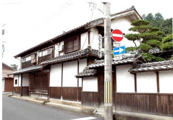
34 下村五郎助家住宅