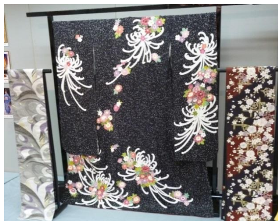
(丹後ちりめんの着物)