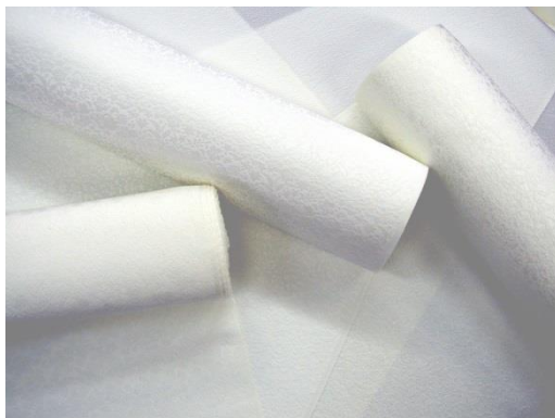
(丹後ちりめんの反物)