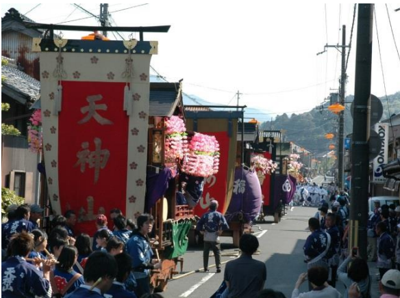
45 加悦・算所の屋台行事