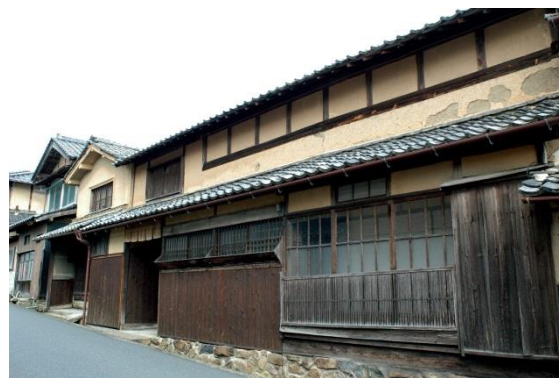
33 下村与七郎家住宅