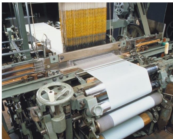
(丹後ちりめんの織機)