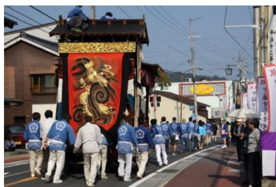
(金刀比羅神社の屋台行事)