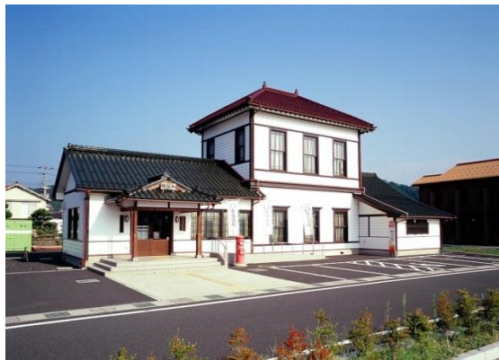
37 旧加悦鉄道加悦駅舎