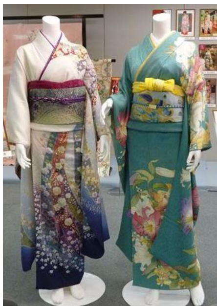
(丹後ちりめんの着物)