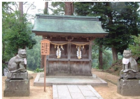
(金刀比羅神社の境内の木島神社)