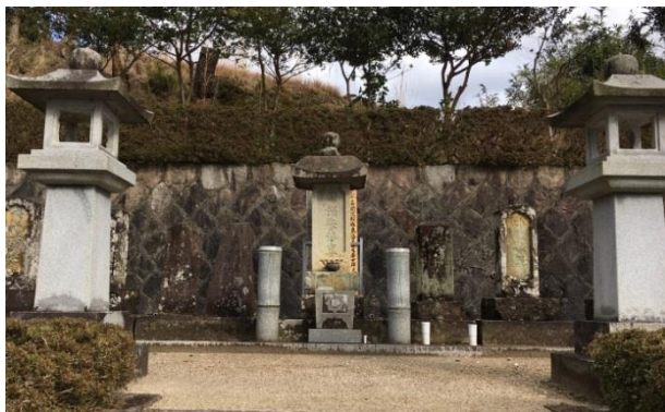
(常立寺 絹屋佐平治 (森田治郎兵衛) の墓碑)