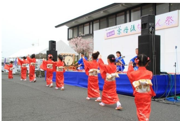
(丹後ちりめん小唄)