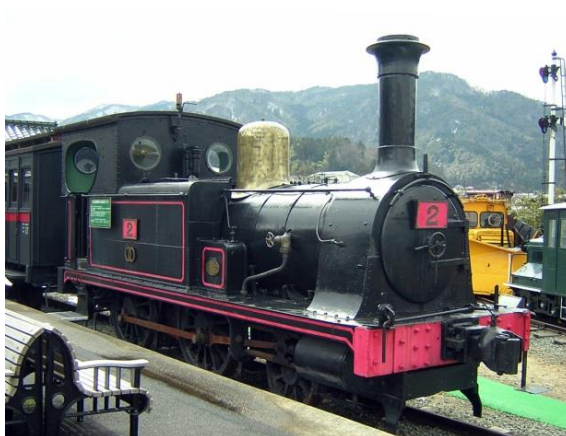
38 旧加悦鉄道 2号機関車 (1 2 3号機関車)