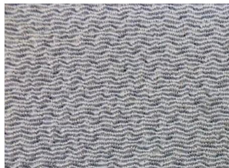
(丹後ちりめんの「シボ」)