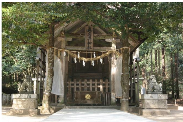
25 籠神社奥宮 真名井神社