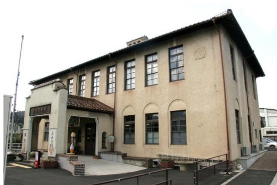
36 旧加悦町役場庁舎