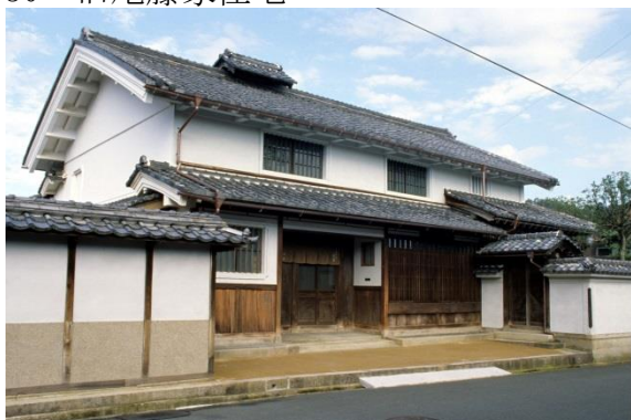
31 西山機業場の建物群