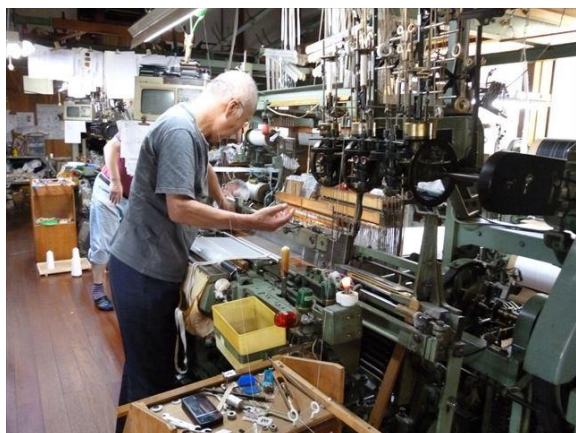
(丹後ちりめんの製織作業の様子)