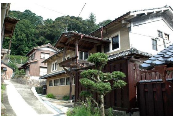
(西山機業場の織物工場)