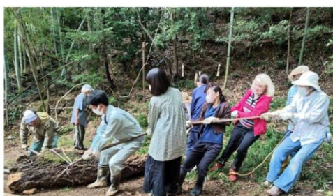
里山で作業する様子 「NPO法人ヒートネットワーク京都」チーム

京都府では、令和元年度から「学生×地域つながる未来プロジェクト」を実施し、大学生と地域活動団体の協働をサポートしています。学生チームが各受入団体の活動に参加し、団体と協働することで、地域活動に目を向ける機会を創出するとともに、団体の受入体制の構築及び大学生の等身大の目線を取り入れた更なる地域活性化を目指しています。