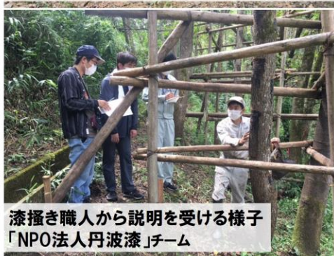
漆掻き職人から説明を受ける様子 「NPO法人丹波漆」チーム