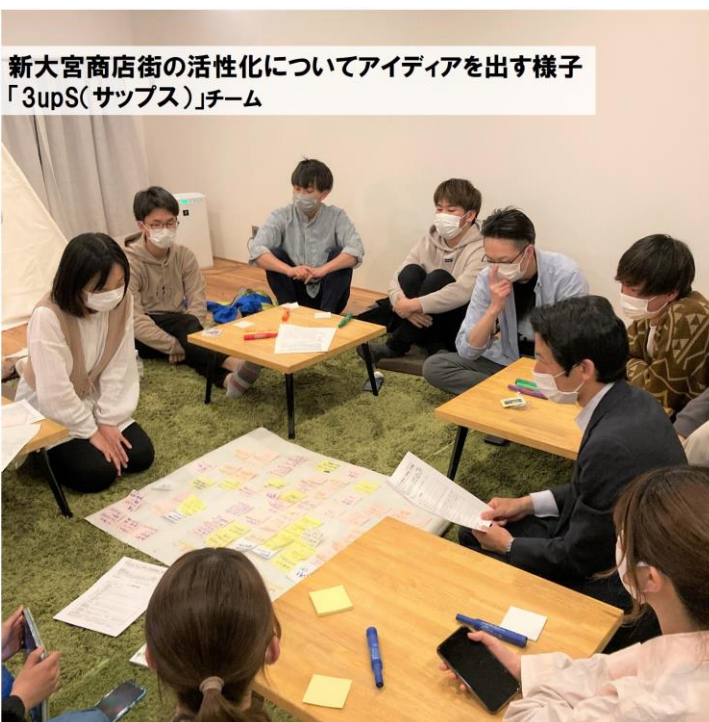
新大宮商店街の活性化についてアイデアを出す様子 「3upS(サップス)」チーム