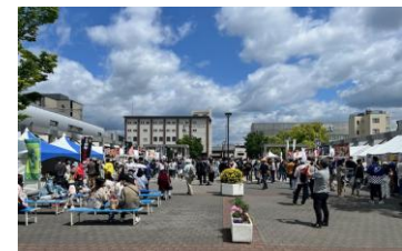
イベント会場の様子