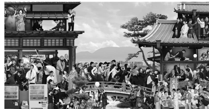
JR, The Chronicles of Kyoto, Close Up, Japan, 2024