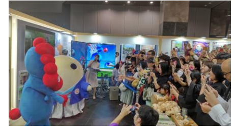
魅力発信ブースでのフィナーレイベントの様子