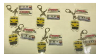
リアル桃太郎電鉄コラボ アクリルキーホルダー