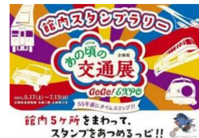
企画展 「1970年 あゆみの交通展」

過去の万博紹介により懐かしむ声を頂いたり、大阪・関西万博の広報活動としても機能できた。