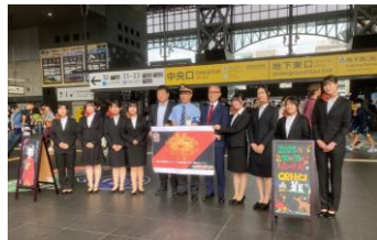
森の京都QRトレインツアー