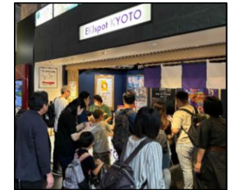
情報発信拠点の様子