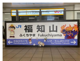
リアル桃太郎電鉄 駅名看板風シート設置