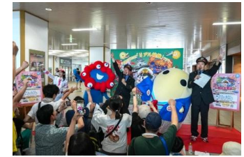
北部エリア編オープニングイベントの様子