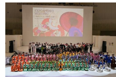
KYOTO EXPO MEETING