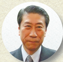
京都府立医科大学大学院 教授 渡邊 能行