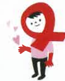
京都市エイズ啓発キャラクター あかりん