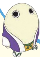
京都府広報監 まゆまる