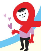
京都市エイズ啓発キャラクター あかりん