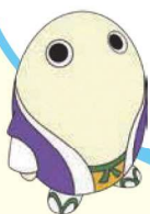
京都府広報監 まゆまる