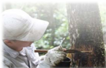
丹波漆掻きの様子