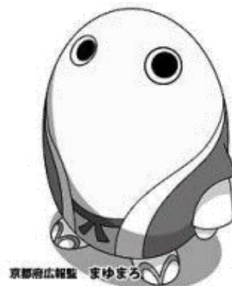
京都府広報監 まゆまろ

家庭・青少年支援課 ひとり親・ヤングケアラー支援係 TEL 075-414-4585