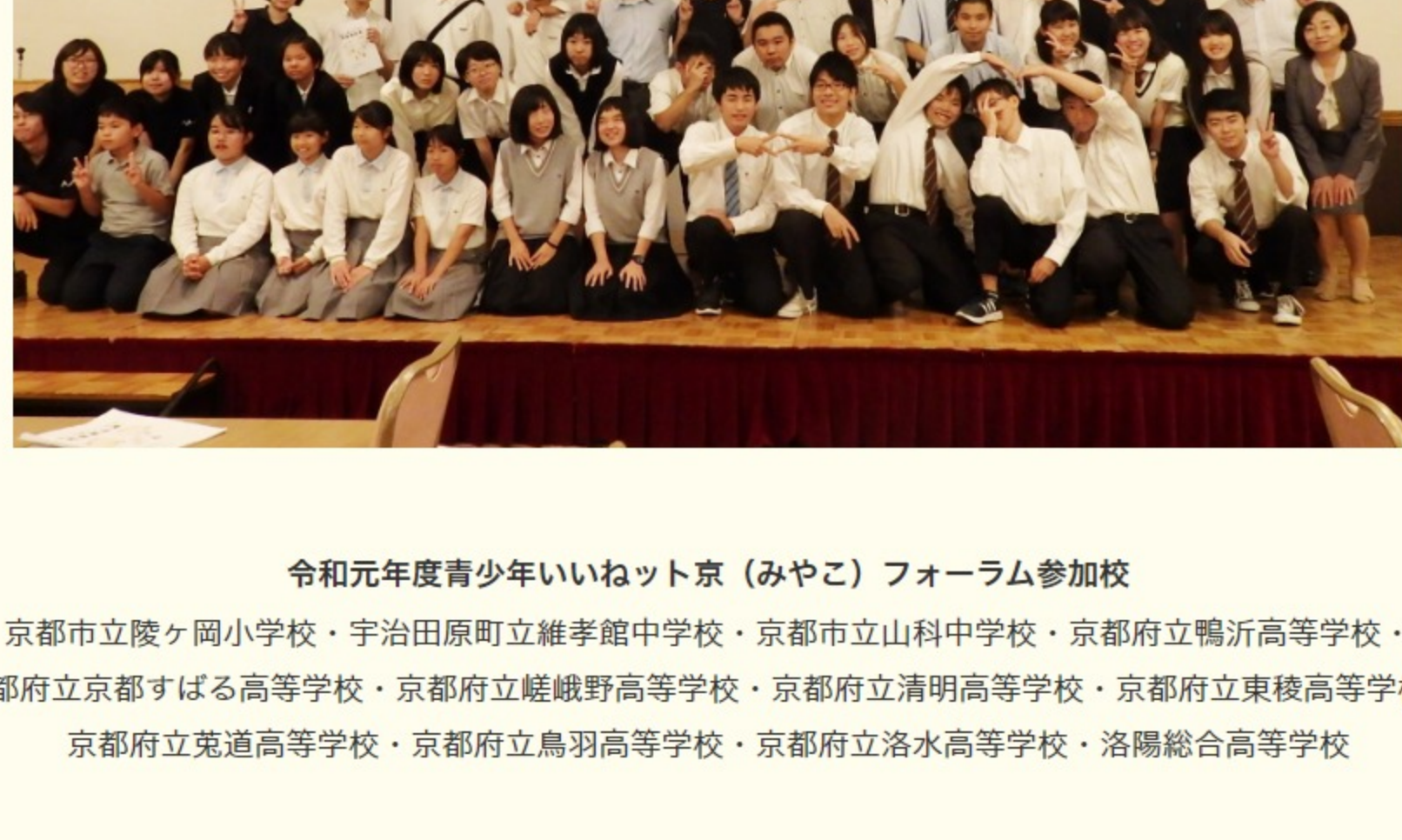
令和元年度青少年いねット京（みやこ）フォーラム参加校

京都市立陵ヶ岡小学校・宇治市原町立維孝館中学校・京都市立山科中学校・京都府立鴨沂高等学校・京都府立京都すばる高等学校・京都府立嵯峨野高等学校・京都府立清明高等学校・京都府立東陵高等学校・京都府立竜谷高等学校・京都府立鳥羽高等学校・京都府立洛水高等学校・洛陽総合高等学校