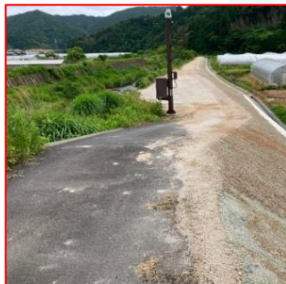
図-2 堤防整備嵩上げイメージ