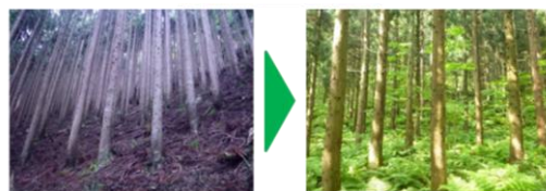
間伐実施前 間伐実施後