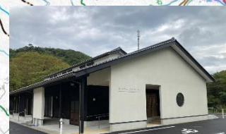
図-5 令和6年度避難所完成