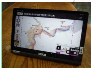
図-3 全戸配布ネットワーク回覧板「いねばん」を用いた防災情報発信の高度化