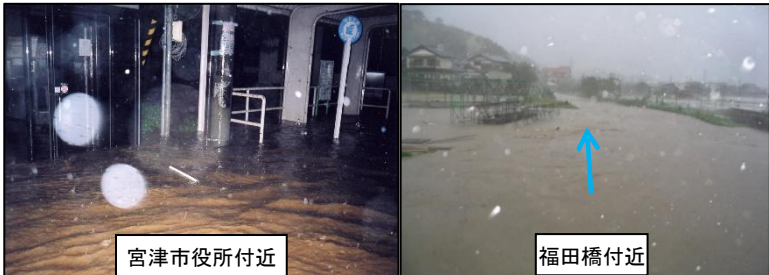
平成16(2004)年台風23号による被害 『浸水家屋 2485戸、浸水面積 約170ha』