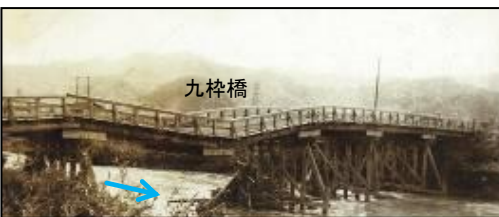
昭和28年台風13号による被害 『舞鶴市全域：浸水家屋 約19,000戸、浸水面積 825ha』