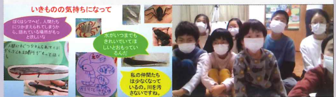
人間中心ではなく 生きものの気持ちになって川のことを考えたい！

5つの小学校 2つの中学校の 20人の仲間と活動しています。地元の方から昔の川とくらしの話を聞き、壁新聞も作りました。生きものの気持ちになって、私たちができる5つのことをまとめました。