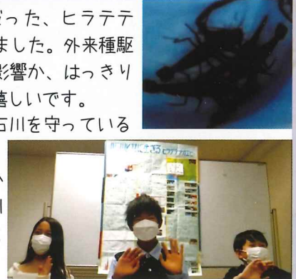
これからも明石川とともに生きていきたいです！

神戸市絶滅危惧種だった、ヒラテテナガエビが増えました。外来種駆除の成果が温暖化の影響か、はっきりはわかりませんが、嬉しいです。以前は、私たちが明石川を守っていると思っていたけれど、コロナが始まってから、私たちが明石川に守られていることに気づきました。