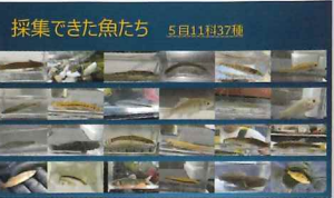
いつまでもたくさんの魚が住むきれいな桂川に！