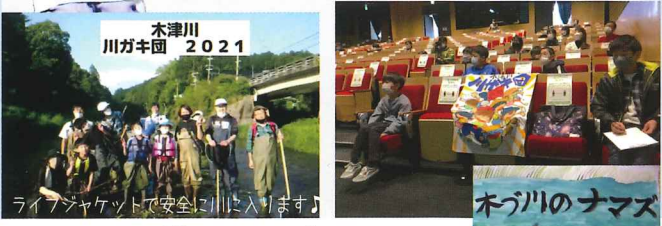
生きものが豊かな木津川で、 楽しく安全に遊び学びます。

ヨシノボリ、ナマズ、シジミ、アカハライモリ、シマドジョウなどを観察しました。マイクロプラスチックゴミ問題に気づき、「ちよこっとゴミひろい」も始めました。