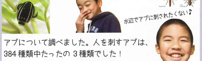
生きものを守りながら水辺で安全に遊びたい！

絶滅危惧種ゲンゴロウについて調べました。農薬と外来種によりほとんど絶滅しています。よどんだ池にいることが多いです。