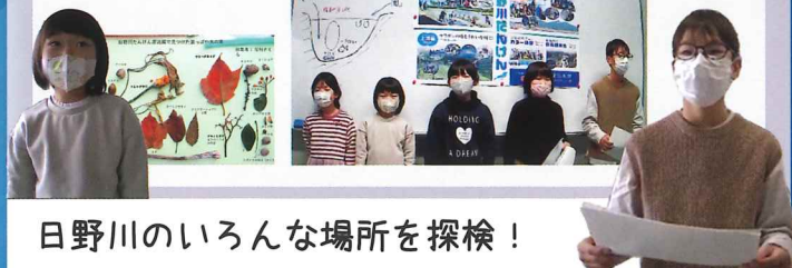
日野川のいろいろな場所を探検！

琵琶湖の東、綿貫山を源流とする日野川と支流の佐倉川を、源流、中流、上流と分けて調査、そこに暮らす生きものを調べました。魚、昆虫、野鳥に出会い、落ち葉や木の実などを拾いました。冬の雪と春の雪解け水で、琵琶湖の深呼吸ができて良いと思います。