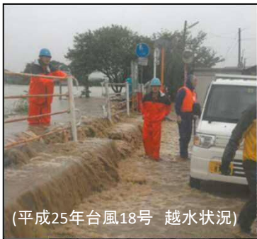
(平成25年台風18号 越水状況)