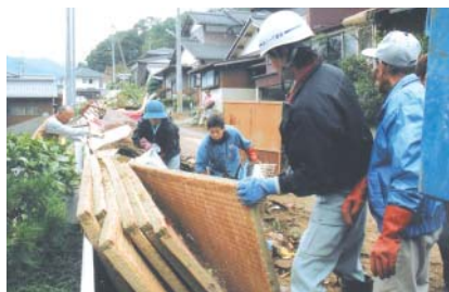
泥まみれの畳を懸命に運び出す人たち