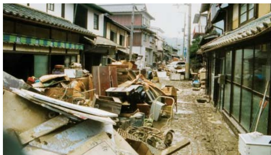
泥をかぶって使えなくなった畳や家具

この台風は人々の暮らしに大きな影響を与えましたが、住民のみなさんや各地からかけたボランティア、自衛隊、消防、警察、行政の力を合わせて、ようやく復旧することができました。