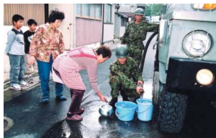
陸上自衛隊による給水活動

この台風は人々の暮らしに大きな影響を与えましたが、住民のみなさんや各地からかけたボランティア、自衛隊、消防、警察、行政の力を合わせて、ようやく復旧することができました。