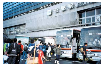
ボランティアは各地からかけた