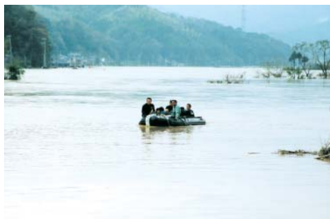
由良川がはん濫し、住民をボートで救助する自衛隊