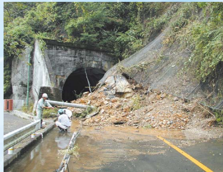
かけ崩れて通行できなくなった府道綾部宮島線(旧美山町)

旧瑞穂町、旧丹波町、旧日吉町で被害が大きく、土砂くずれや河川のはん濫で道路が通行止めになった地域もたくさんありました。