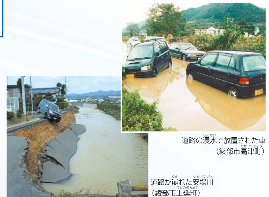
道路の浸水で放置された車(綾部市高津町)

由良川の水位が急激にあがり、道路には水があふれ、川の堤防がくずれるなどの被害が発生し、20数年ぶりに避難勧告が出され、学校や公民館などにたくさんの住民が避難しました。