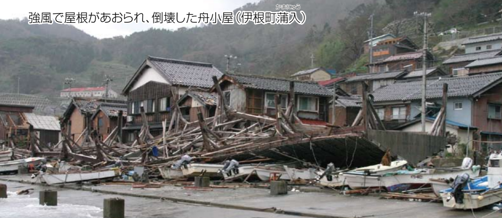
強風で屋根があおられ、倒壊した舟小屋(伊根町蒲入)

海沿いの舟小屋の屋根が風にあおられ吹き飛び、雨と海水が家に入ってきて家具やたたみが使えなくなりました。畑などでは、ビニールハウスが暴風により被害を受け、また、家の窓ガラスが割れる被害も発生しました。