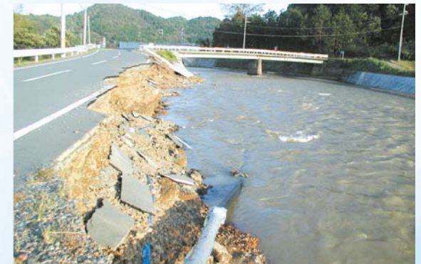
護岸が崩れた高屋川(旧丹波町)