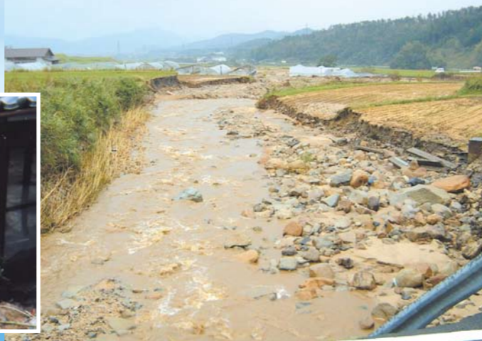
堤防が壊れた野田川では、約75haが浸水