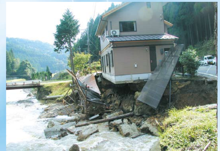
木住川の洪水で土地がえぐられた住宅(旧日吉町)