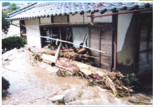
泥水は住宅地にも流れ込みました

野田川の洪水で堤防が崩れ周囲の人家が浸水しました。泥水は丹後ちりめんの工場や農地にも大きな被害をもたらしました。