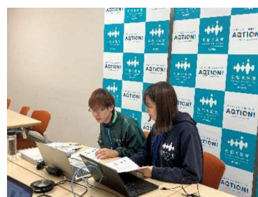
オンラインでの出張授業のようす