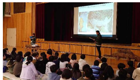
対面での出張授業のようす