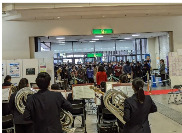
オープニングセレモニー（地元高校 吹奏楽部）