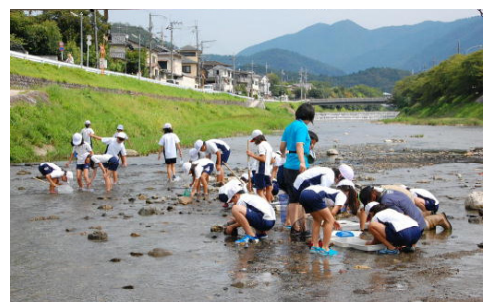
図3-35 身近な川の生物調査

なお、調査結果は水質階級Ⅰ「きれいな水」とⅡ「ややきれいな水」と判定された地点を合わせると約82%（40地点）となり、全体的に水質は良好でした。