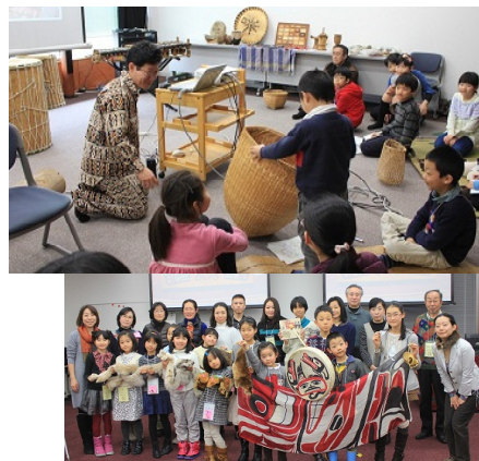
図3-38 ワークショップの様子

1月から3月にかけて、次世代を担う小学生から高校生までの子どものべ100名超が参加し、北山杉の枝打ちや丸太磨き等の体験や、ワークショップ形式での異文化体験を通して、人と自然のつながりや地球にやさしいライフスタイルについて考えました。