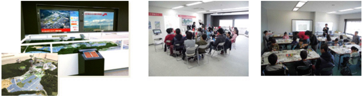
図3-33 けいはんなe 2 未来（イーミライ）まなびパーク

本施設を校外学習の場として活用していただくとともに、夏休み等には親子で環境・エネルギー問題を学ぶ参加・体験型のワークショップを開催するなど、広く活用しています。