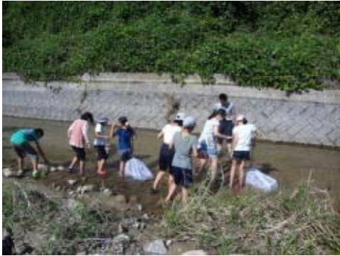
図3-34 川の生き物観察と木の伐採作業

10月12日（土）～13日（日）の1泊2日、次代を担う小学生11名が参加し、波見川での生き物観察、森に生えるどんぐりの木の違い、木の伐採作業、蜜蜂の生態や蜂蜜についての学習、夜に星空を観察するナイトウォークなどを行いました。