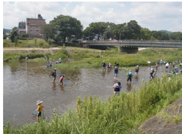
表3-53 「身近な川の生物調査」参加団体