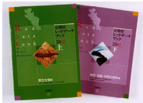
図3-10 府レッドデータブック（2002年版）

「種の保存法」によって保護される全国的に希少な野生生物以外であっても、府内で絶滅のおそれのある野生生物を対象に保全を図り、府内の生物多様性を守る。