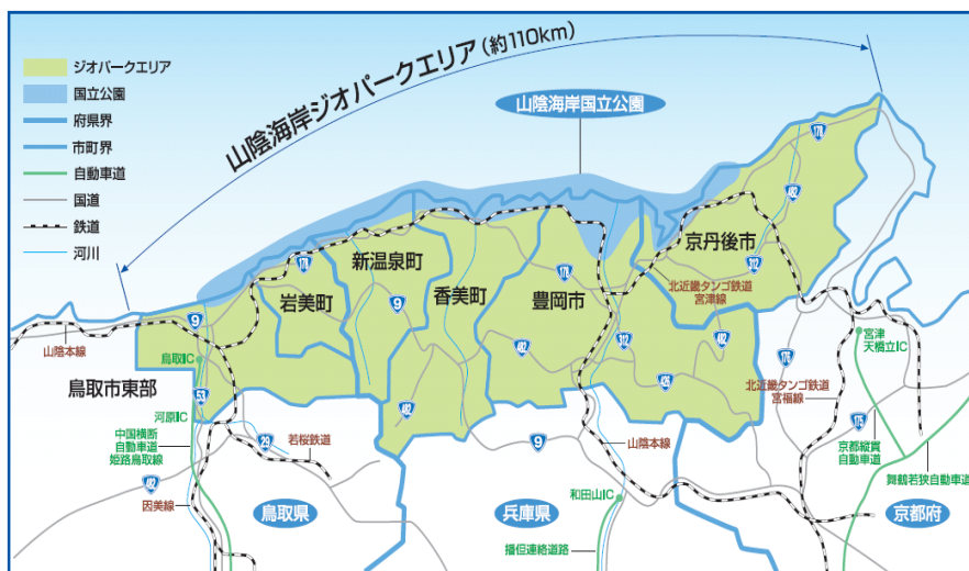
図3-13 山陰海岸ジオパークのエリア

府、兵庫県、鳥取県、京丹後市ほか関係市町等で組織した山陰海岸ジオパーク推進協議会(会長：豊岡市長)と連携し、ジオサイトの整備、学術調査研究活動の充実などを進めるとともに、環境学習体験やジオガイドの養成、観光振興等の取組を進めています。