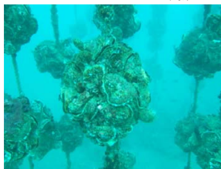
図3-14 イワガキの養殖

水産業においては、環境負荷の軽減を図るため、トリガイ・イワガキなど二枚貝の無給餌養殖を推進するとともに、魚類養殖については食べ残しを出さないよう適切な給餌に取り組んでいます。