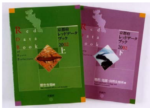
図3-7 府レッドデータブック（2002版）

府内の自然生態系の現状として、「地域生態系」「生息生育地」「人間－環境系の歴史的側面」の3つの観点から取りまとめました。地域生態系では府内の重要な植物群落36種類の特徴と分布等のほか、地域生態系レッドリスト210箇所を紹介しています。そのほか、生息生育地として京都競馬場中央池や琵琶湖疏水での合同現地調査結果を、人間－環境系の歴史的側面として、府内におけるかつての自然景観やその背後にあった人と自然との関わり等を現在との比較も含めながら紹介しています。