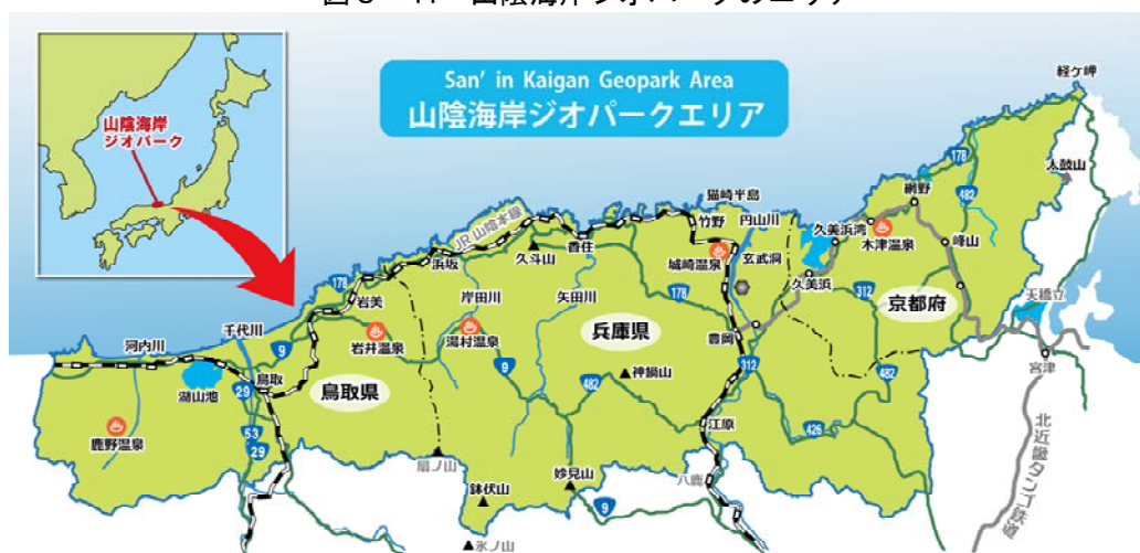
図3-11 山陰海岸ジオパークのエリア

府、兵庫県、鳥取県、京丹後市ほか関係市町等で組織した山陰海岸ジオパーク推進協議会(会長:豊岡市長)と連携し、ジオサイトの整備、学術調査研究活動の充実等を進めるとともに、環境学習体験やジオガイドの養成、観光振興等の取組を進めています。