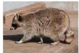
図3-12 アライグマ(特定外来生物)

北米原産のアライグマは、現在、府内全域で生息が確認されており、農作物や生態系、文化財等への様々な被害が出ています。特に被害の多い中丹・南丹・山城地域では、府・市町村が協議会を組織し、捕獲・運搬、処分等の役割を分担しながら、「外来生物法」に基づく防除を行っています。