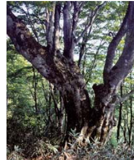
図3-10 府自然環境保全地域 (丹後上世屋内山地区)