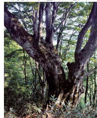
図3-8 府自然環境保全地域 (丹後上世屋内山地区)