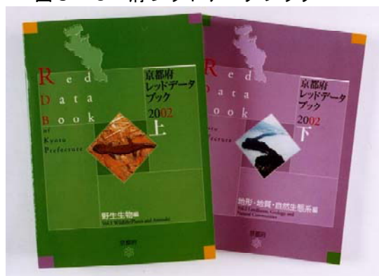
図3-6 府レッドデータブック

ホームページでの公表などを行ったほか、学識者やNPOによる希少野生生物等保全方策検討委員会を設置し、15年11月に「絶滅のおそれのある野生生物等の保全方策に関する提言」を取りまとめられました。