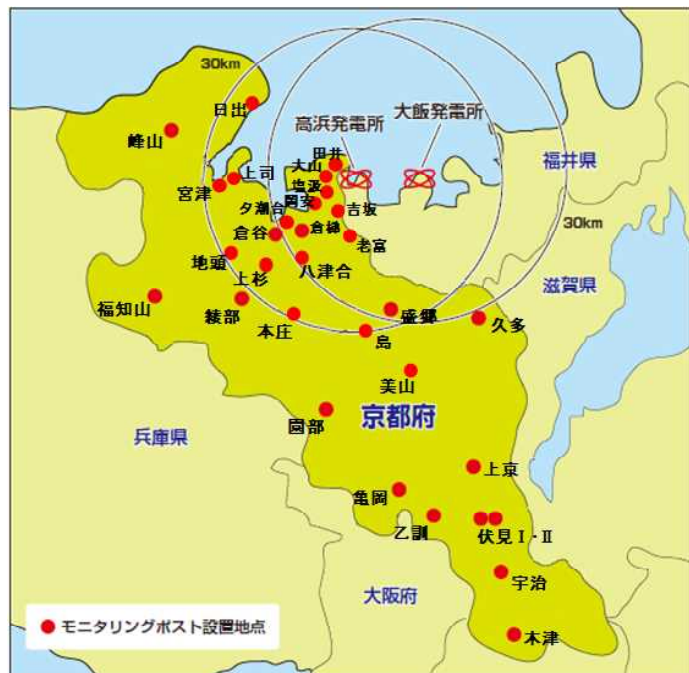
図3-40 モニタリングポスト設置地点（28年度）

調査結果については、学識経験者等で構成する「高浜発電所及び大飯発電所に関する環境測定技術検討委員会」において、28年度についても「周辺環境に対する異常は認められず、環境安全上問題はなかった」旨の意見をいただいています。