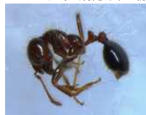
図3-19 ヒアリ(特定外来生物)

南米原産のヒアリは、非常に強い繁殖力を持ち、生態系、農畜産業への被害があるほか、人が刺された場合、体質によってはアナフィラキシー・ショック（急激で重度なアレルギー症状）を起こす可能性があります。日本でも29年6月以来各地で確認されていますが、現在のところは定着には至っていないと考えられています。府では同年10月に確認され、即日駆除を行いました。