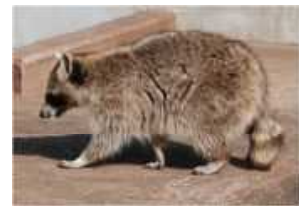
図3-15 アライグマ（特定外来生物）

北米原産のアライグマは、現在、府内全域で生息が確認されており、農作物や生態系、文化財等への様々な被害が出ています。特に被害の多い中丹・南丹・山城地域では、府・市町村が協議会を組織し、捕獲・運搬、処分等の役割を分担しながら、外来生物法に基づく防除を行っています。