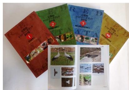
図3-10 府レッドデータブック

府レッドデータブック2015では、府内の野生生物を取り巻く環境が大きく変化したことから改訂を行いました。その結果、300種を超える野生生物が新たに絶滅のおそれがある種として掲載され、多くの種がより危険性の高いカテゴリーのランクへと移行するなど、府内においても生物多様性の危機が一層進行していることが明らかになりました。その大きな原因はニホンジカの急増や里山の放置等による下層植生の消失で、それに伴い絶滅のおそれのある野生植物の種が増え、そこに生息する昆虫や小型哺乳類も絶滅のおそれが高まっています。また、アライグマやブラックバス等による捕食や、チュウゴクオオサンショウウオと在来種との交雑等、外来種による影響も顕著になりました。一方で今回調査が進んだことにより、これまで府内では既に絶滅したと思われていた種の再発見や新たな生息地が発見された例もありました。