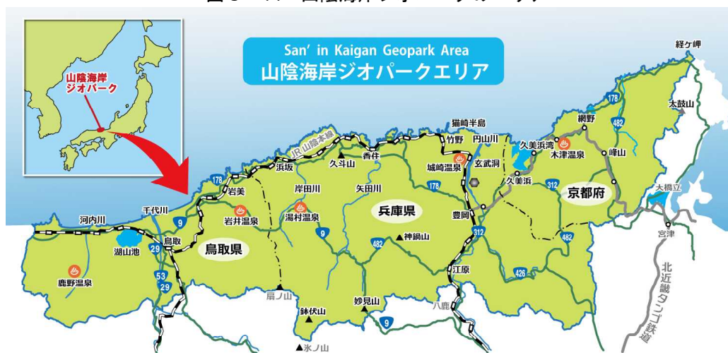
図3-14 山陰海岸ジオパークのエリア

府、兵庫県、鳥取県、京丹後市ほか関係市町等で組織した山陰海岸ジオパーク推進協議会（会長：豊岡市長）と連携し、ジオサイトの整備、学術調査研究活動の充実等を進めるとともに、環境学習体験やジオガイドの養成、観光振興等の取組を進めています。