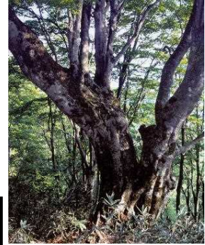
図3-13 府自然環境保全地域 (丹後上世屋内山地区)