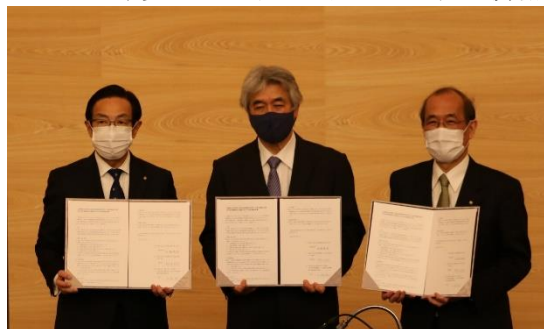
三者による包括連携協定を締結

なお、京都府及び京都市、総合地球環境学研究所は、適応策だけではなく、脱炭素社会の構築に向けた取組の一層の促進を図るため、令和3（2021）年4月23日に「京都府及び京都市と総合地球環境学研究所との地球温暖化対策及び地球環境研究の推進に向けた包括連携協定」を締結しています。