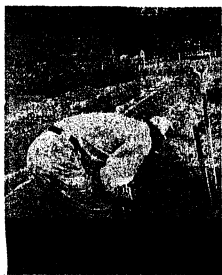
▲昔ながらの長芋の収穫

明治期には、水主の浜から舟で天満に出荷され、師走の市場で売りに買われたという記録が残っています。相場は毎年変動しますが、一荷あたりサツマイモの2倍強の価値がついています。