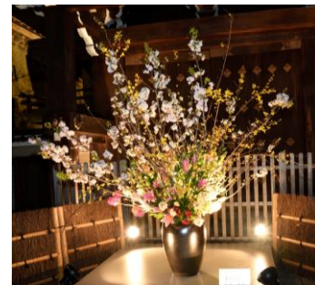
「いけばなプロムナード」

イラストやメッセージなど、来場者が自由に描いたオリジナルデザインの行灯を作成・展示