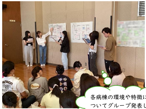
まとめの会の様子