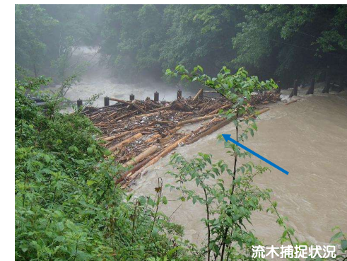
令和3年5月21日 午前11時頃撮影