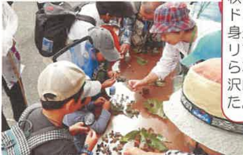
ドングリにはどんな種類があるかな？