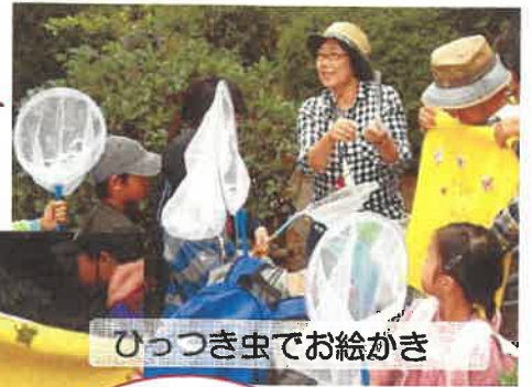
ひっつき虫でお絵かき

通称「ひっつき虫」と呼ばれるアレチヌスピトバギ。みんなの足にもいっぱいひっついてました！