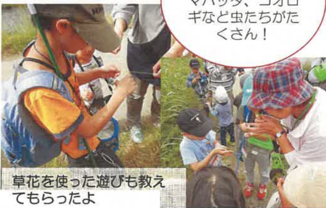
草花を使った遊びも教えてもらったよ

最後に発見した虫たちをじっくり観察。バッタとキリギリスの違いや外来種のオンブバッタがなぜ増えたのかなど学びました。