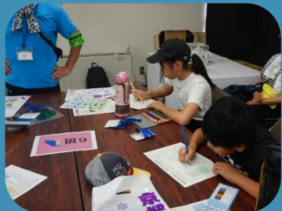
ぬりえて生きものの特徴を勉強！