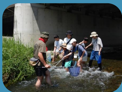
なにかとれたかな？