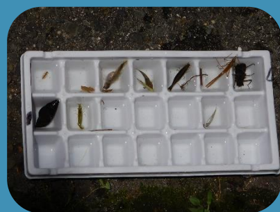
生きものがたくさんとれました！