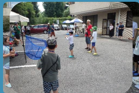
今日の成果を発表！