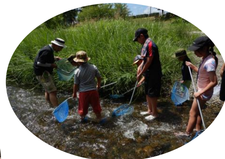
なにかとれたかな？