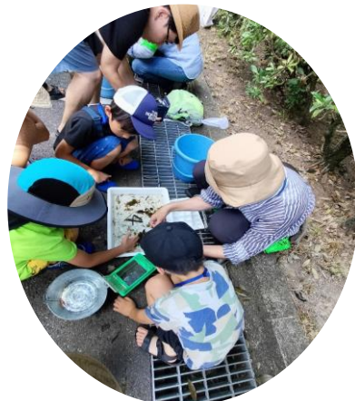
どんな生きものがとれたかな？