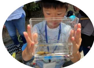
おおきな魚とれました！