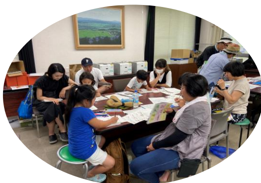
ぬりえで生きものの特徴を勉強！