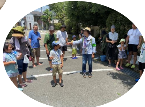
暑い中、皆様 お疲れ様でした♪