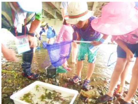
どんな生きものがあるかな？