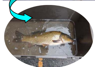
大きなコイがかかりました！