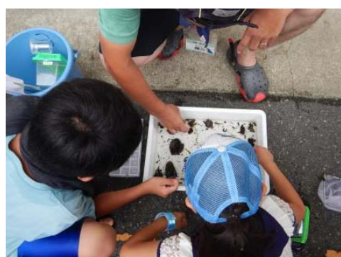
何が採れたか、みんなで話し合い...