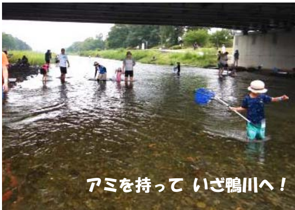
アミを持って いざ鴨川へ！