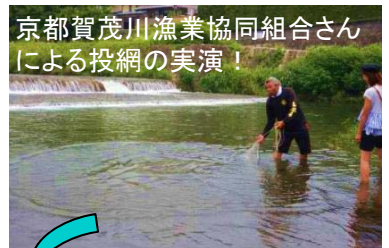
京都賀茂川漁業協同組合さんによる投網の実演！