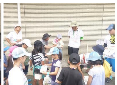
観察結果を班ごとに発表！！

コオニヤンマ(ヤゴ)、アメリカザリガニ、カワリヌマエビ... 沢山見つけました♪