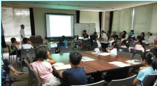
みんな熱心に聞いてくれました