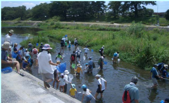
あみを持ってさあとるぞ！