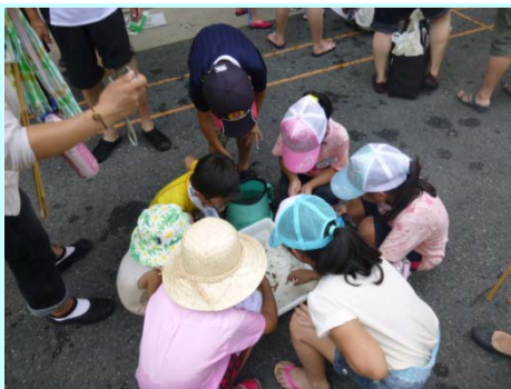
とれた生きものをみんなで見たよ