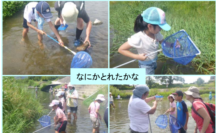
なにかとれたかな