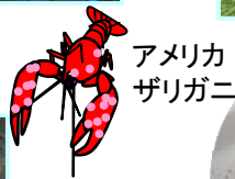
アメリカザリガニ