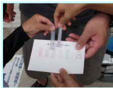
鴨川の水質を調べたよ