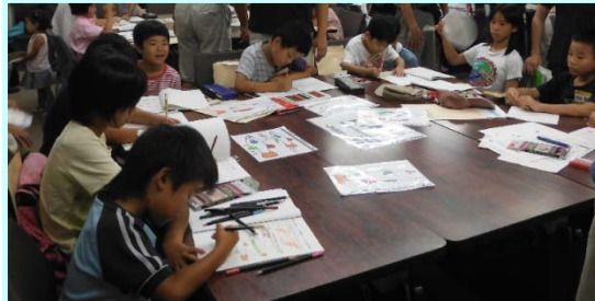
みんなで魚のぬりえをしました