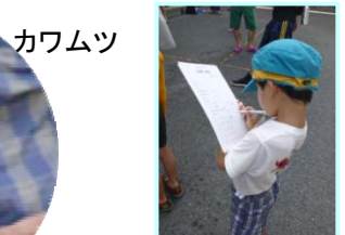
班ごとに発表したよ