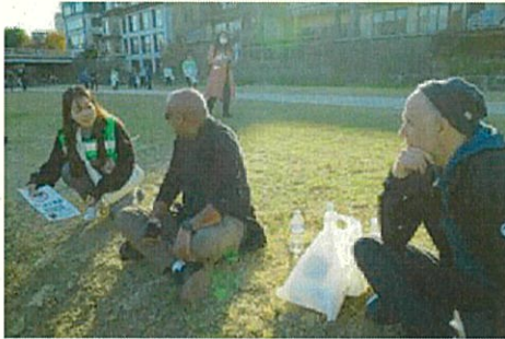
河川敷で飲食する外国人観光客に声をかける大学生ボランティア（京都市中京区）