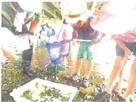
どんな生きものがあるかな？