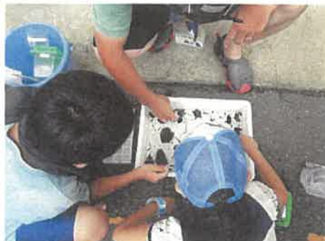
何が採れたか、みんなで話し合い...