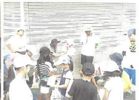
観察結果を班ごとに発表！！

コオニヤンマ(ヤゴ)、アメリカザリガニ、カワリヌマエビ... 沢山見つけました♪