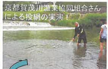
京都賀茂川漁業協同組合さんによる投網の実演！