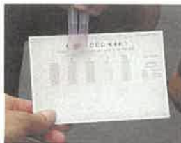
↑CODパケットを使って、鴨川の水質も調べました！

コオニヤンマ(ヤゴ)、アメリカザリガニ、カワリヌマエビ... 沢山見つけました♪