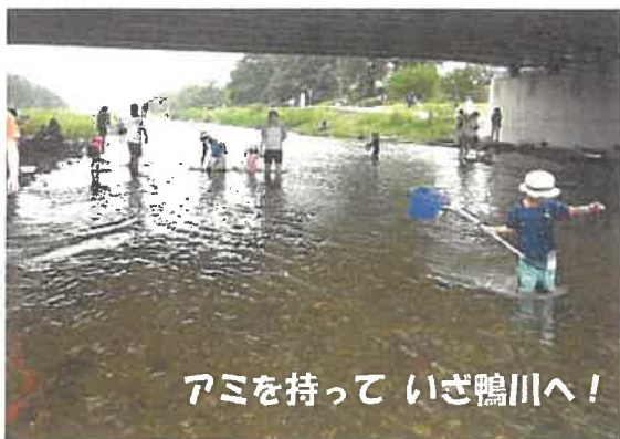
アミを持って いざ鴨川へ！