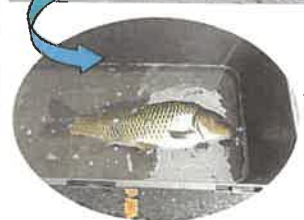
大きなコイがかかりました！