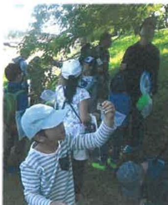
おいしそうに熟したムクの実を探して、ぱくり。