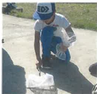
みんなでたくさん虫を捕まえました！