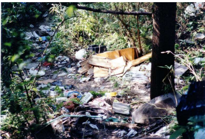
ゴミの不法投棄(回収済み)