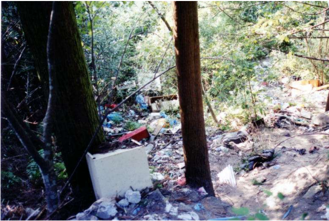
ゴミの不法投棄(回収済み)