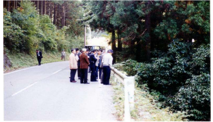
ゴミの不法投棄場所視察中