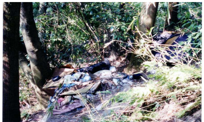
ゴミの不法投棄(回収済み)