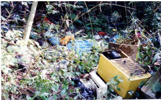
ゴミの不法投棄(回収済み)