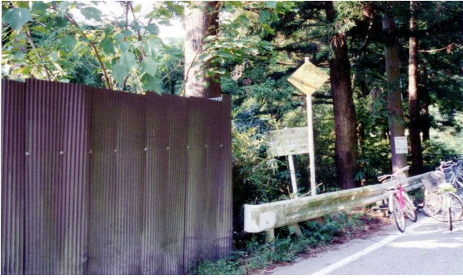
ゴミの不法投棄場所