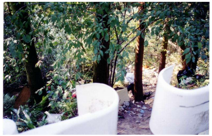
ゴミの不法投棄(回収済み)