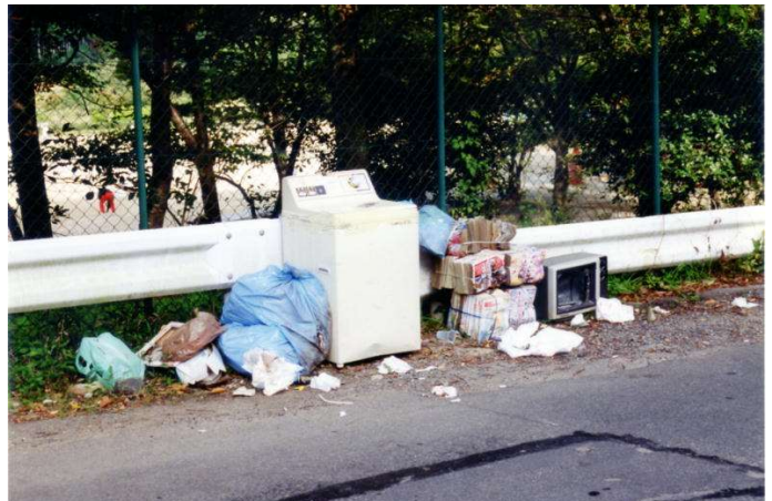
柗野グラウンド側道/ゴミの不法投棄(回収済み)