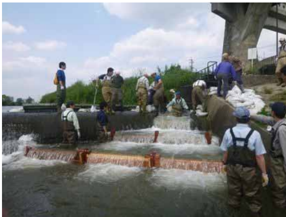
仮設魚道の設置作業