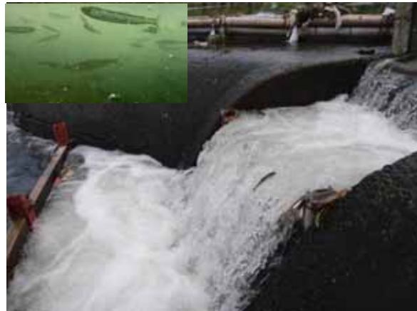
仮設魚道を遡上するアユ （左上は堰の下に群れるアユ）

アユ等の5-7月の遡上個体推定数：32,683 個体（測定日のみの推定個体数） 小：10cm未満， 中：10-12cm， 大：12cm以上