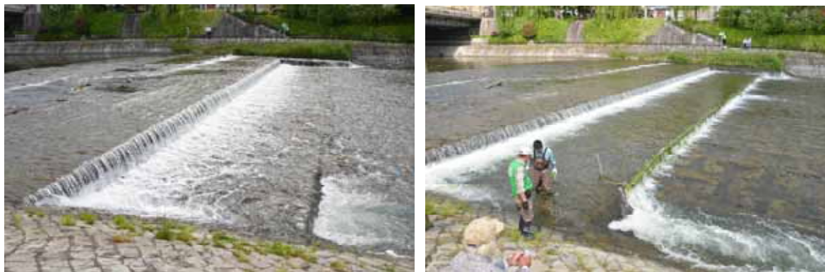
四条大橋下流の落差工の竹柵設置直前・直後の比較

今後、魚類分布調査（桂川合流点から賀茂川・高野川合流点付近まで）で遡上状況を確認予定。