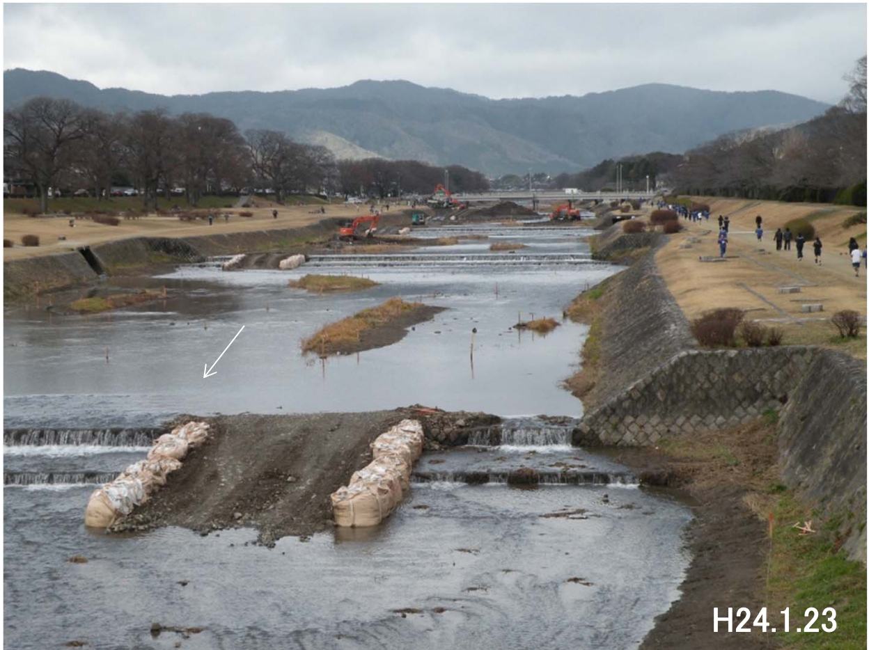
中州除去のようす(高野川 馬橋～松ヶ崎橋)