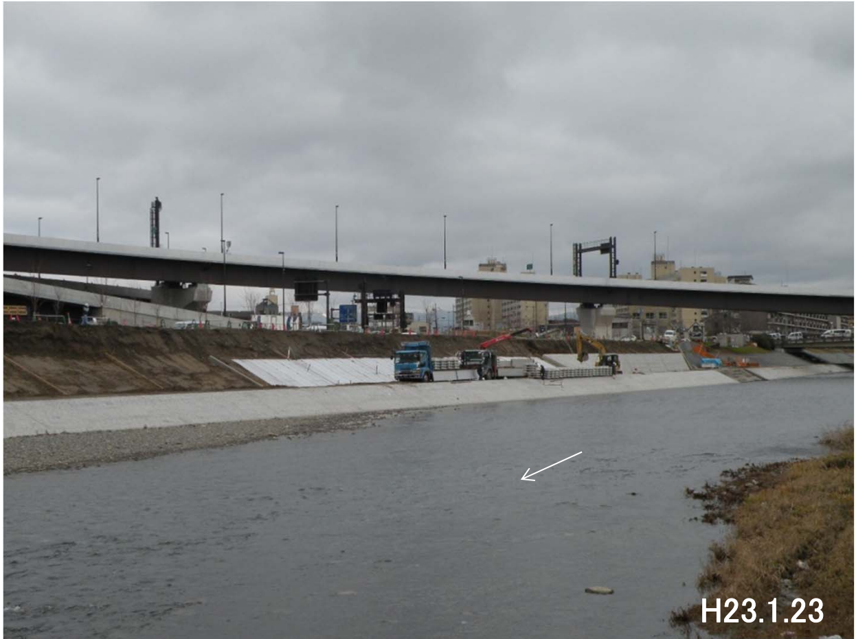
護岸整備工事のようす(近鉄橋～勸進橋)