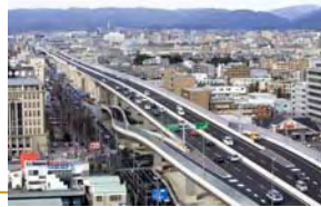
▲京都高速(都心方面を望む。)