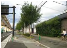
▲油小路通(歩道再整備中)