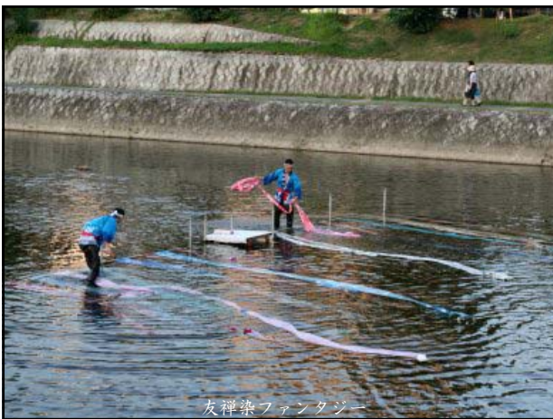
友禅染ファンタジー