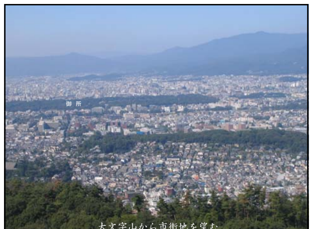
大文字山から市街地を望む