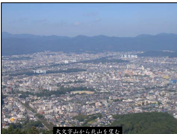
大文字山から北山を望む