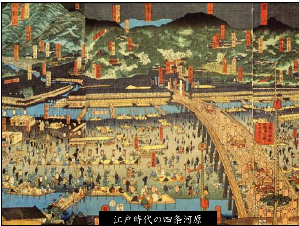
江戸時代の四條河原