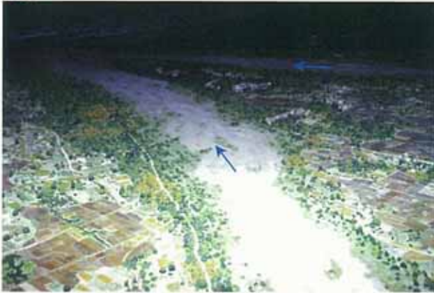
鴨川、高野川合流点付近