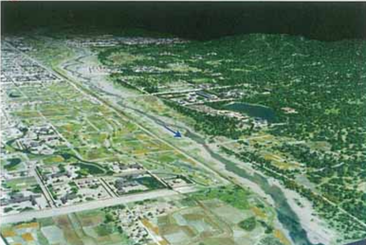
現在の九条付近より上流を望む