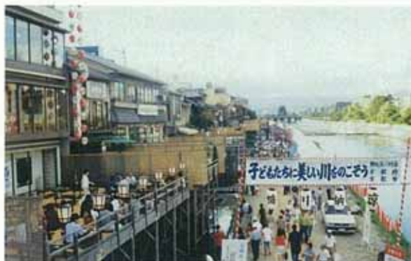
鴨川納涼