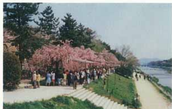
鴨川茶店