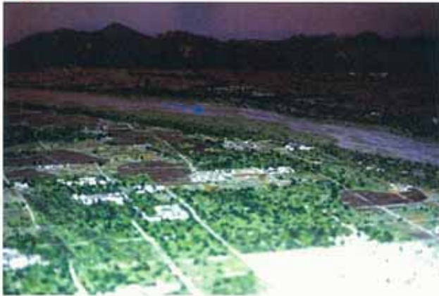
現在の北大路橋付近