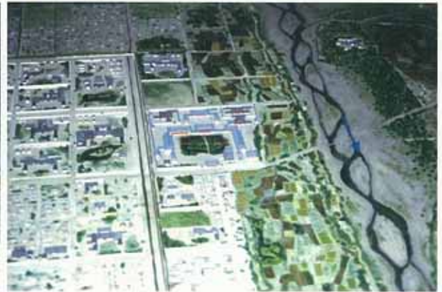
現在の荒神橋付近