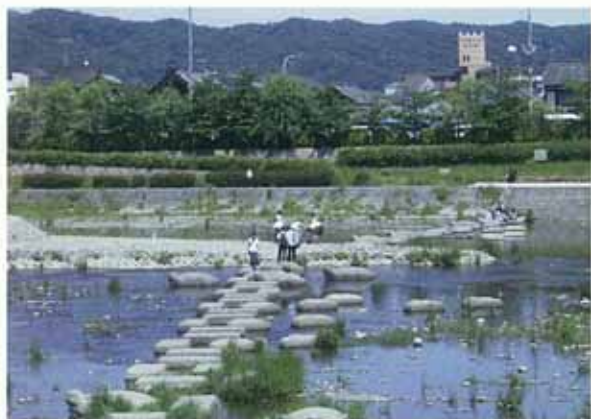
賀茂大橋上流の飛び石