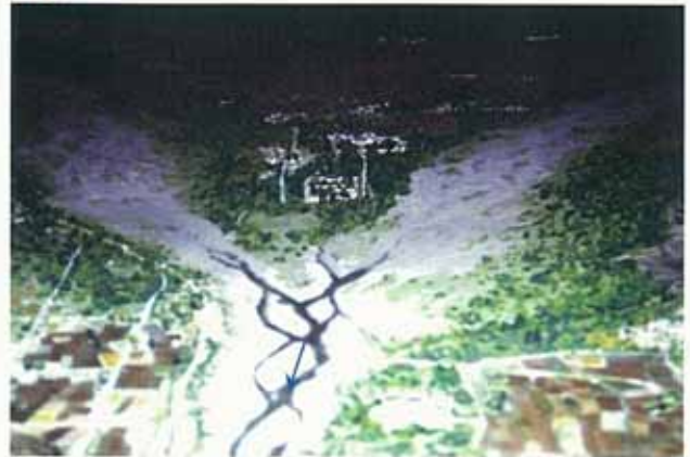
鴨川、高野川合流点付近