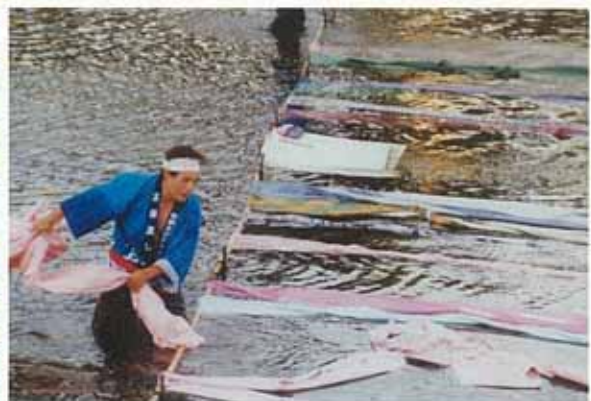
友禅流し（再現イベント）