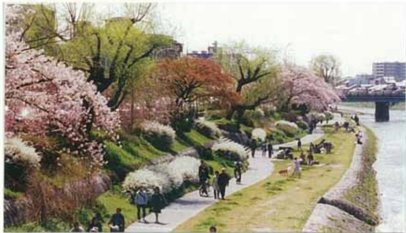
花の回廊(四条～五条)