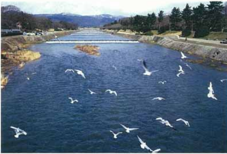
ユリカモメ（北大路橋上流）